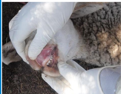
Změny v dutině ústní

V případě zjištění výše uvedených příznaků ihned kontaktujte soukromého veterinárního lékaře nebo příslušnou krajskou veterinární správu .